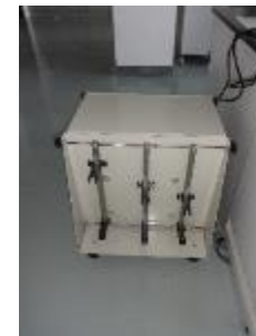
分液漏斗振とう機