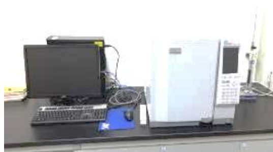
ガスクロマトグラフィ