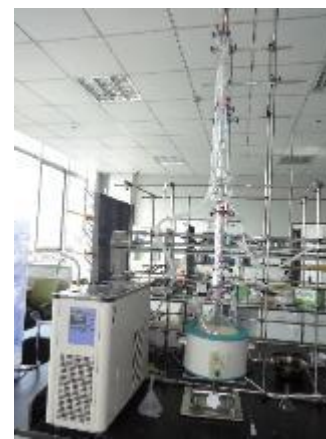
溶媒精留 回収装置