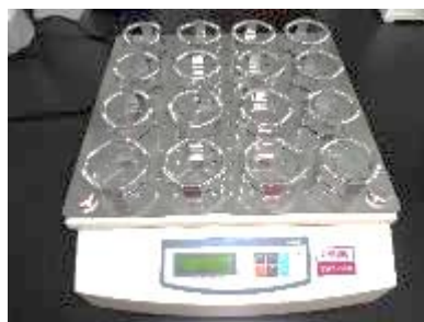
フラスコ振とう機