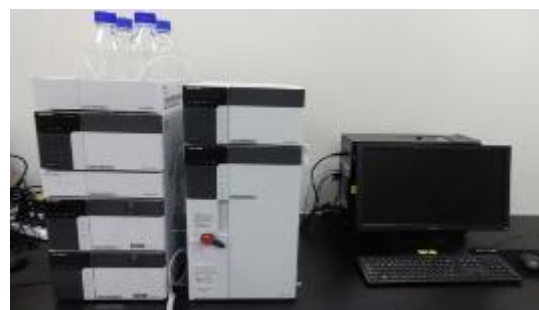
高速液体クロマトグラフィ