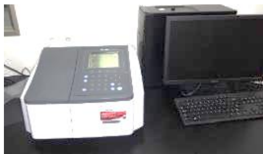
紫外可視分光光度計